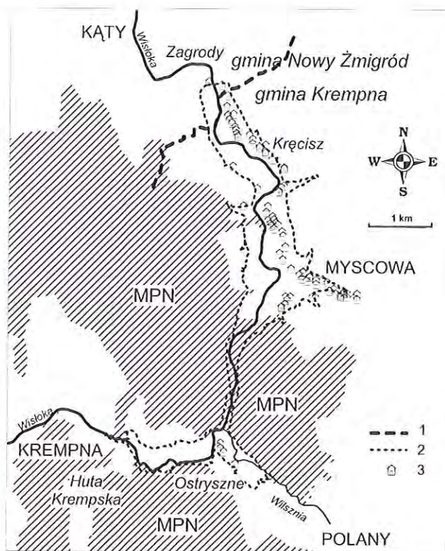
Ryc. 1. Orientacja.

zachowało się kilka zagród tworzących przysiółek Ostryszne (należący do wsi Polany). Duże miejscowości sąsiadujące z omawianym terenem, to Kąty na północy (w dole rzeki), Kremarna na południowym zachodzie (nad Wisłoką) oraz Polany na południowym wschodzie (nad Wilsznią).